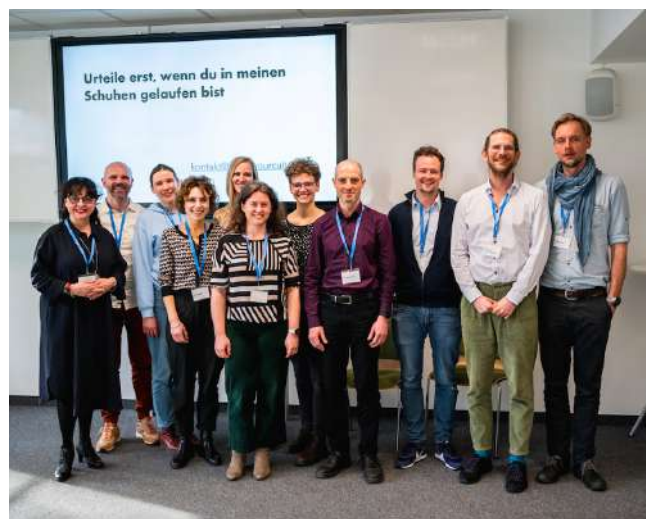
Projekttag „Sprechen im Lehrberuf“ Mehr erfahren

Unter der Überschrift „Reflektieren, Begleiten, Beraten im Lehrberuf“ fand am 24.03.2023 der 9. Projekttag der Arbeitsgemeinschaft „Sprechen im Lehrberuf“ statt.