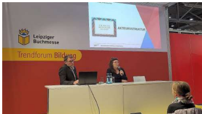
Zwischen Büchern unterwegs Mehr erfahren

Das Projekt StartTraining stellte sich im Rahmen der Reihe „Lehramt studieren – Alles nur Theorie?“ auf der Buchmesse Leipzig vor.